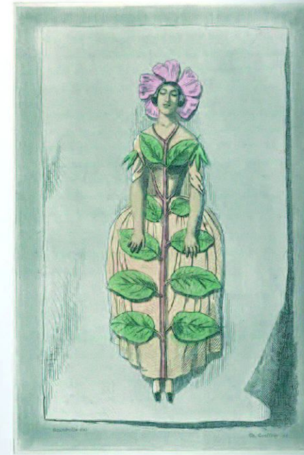
Les fleurs animées / par J.-J. Grandville Paris : Gabriel de Gonet, [1847] Biblioteca Universitaria de la UPM. Sede de la ETSI Agrónomos