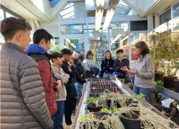
Imagen de archivo de una visita escolar al invernadero de trabajo