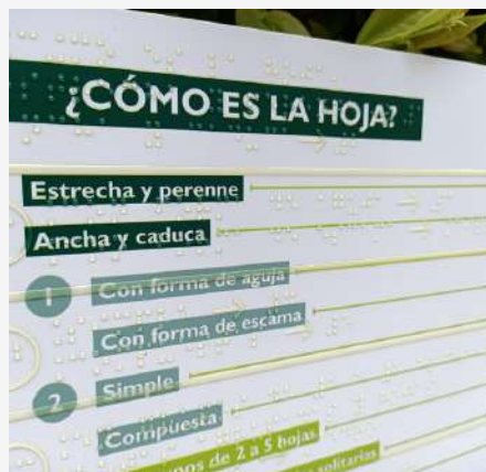
Uno de los materiales adaptados en alfabeto Braille