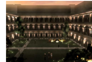
Ilustración 2 Render preliminar del proyecto