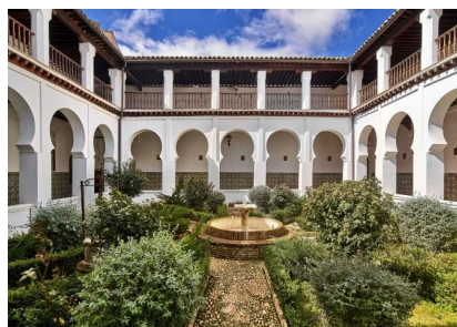
Ilustración 6 Convento de Santa Clara

La propuesta impulsada por la propia congregación planteaba el hecho de que una parte diferenciada y del convento pasase a alojar uso residencial estudiantil colaborativo, estando abiertas incluso a la desacralización de la iglesia si fuera necesario un cambio de uso.