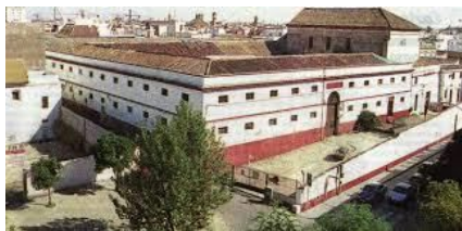
Ilustración 5 Convento de San Laureano

La aproximación de escala humana y residencial de esta intervención resulta de elevado interés para los principios de este trabajo y sirve de ejemplo claro de como los monumentos monásticos tienen posibilidad de adaptarse a los usos residenciales modernos. Sin embargo, la intervención fragmentaria en el edificio ha resultado inevitablemente en la desaparición prácticamente completa del monasterio, y en la pérdida completa de muchas de sus propiedades espaciales, materiales y simbólicas.