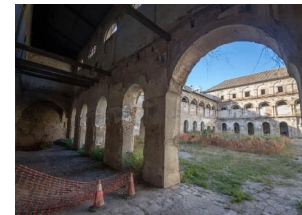
Ilustración 3 Estado del claustro del convento de San Agustín

El proyecto del nuevo hotel se aleja sustancialmente de algunos de los puntos de interés de este trabajo, al volver la cara de forma evidente a muchas de las consideraciones sociales y de regeneración urbana que optimistamente he planteado en otros apartados, y me considero en principio escéptico sobre el efecto que el proyecto pueda tener en la ciudad en este sentido. Sin embargo, si que resulta de interés el a priori enfoque cuidadoso y de puesta en valor de los elementos patrimoniales y materiales del edificio, así como su intención en el aprovechamiento espacial sin demasiadas modificaciones de los lugares tradicionales del convento. Dado que el proyecto aun no está publicado en su totalidad, solo el tiempo nos dejará ver si estas a priori valiosas intenciones en la puesta en valor del patrimonio acaban materializándose, y qué repercusión tendrán en las dinámicas sociales y urbanas del centro de Sevilla.