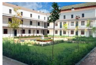
Ilustración 4 Viviendas del Patio de San Laureano