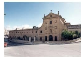
Ilustración 8 Convento de las Concepcionistas

El proyecto ya ha sido terminado y expuesto por el Estudio 10, aunque no parece que las obras hayan comenzado desde su publicación en 2021. La propuesta representa, si su ejecución es tal y como se plantea, un ejemplo de los principios de convivencia, conservación y regeneración urbana que se han defendido a lo largo de este trabajo, donde se pueda respetar la voluntad tanto de los habitantes actuales del convento como de los nuevos que llegarán, así como los intereses tanto de la ciudad como del patrimonio.