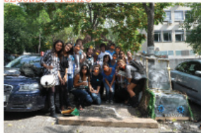
EL PERQUITO DEL PARQUING