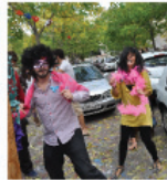
DANCING ON THE FLOOR