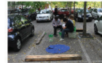
LIVING THE PARKING