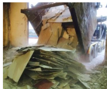
Figura 2. Obra de deconstrucción (caso de estudio I), en la que el residuo de PYL es enviado desde las distintas plantas a través del hueco del ascensor (izq.) En el centro, residuos de PYL en contenedor de obra (caso de estudio II) y recepción del residuo en las instalaciones de una de las plantas de reciclado (drcha.).

Para la toma de datos, se ha utilizado el protocolo de monitorización desarrollado en una de las acciones del proyecto. Este protocolo parte de la identificación y definición de parámetros técnicos, económicos, sociales y medioambientales, que se combinan para dar lugar a 34 indicadores. De entre los parámetros, se han seleccionado los más relevantes para el estudio de la trazabilidad y la calidad del residuo de base yeso generado en las obras. Según se muestra en la Tabla 2, la combinación de dichos parámetros da lugar a los tres indicadores significativos para el seguimiento y control del residuo de yeso.